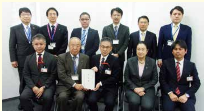
▲令和6年2月 東武鉄道本社

昨年2月から、春日部駅東口の仮駅舎が利用されており、スカイツリーラインの仮上りホームや仮線の工事が進行中です。新しい仮上りホームには現在の上り線とは異なり、2本の線路が設けられます。私たち関係議員は令和6年2月に東武本社を訪れ、追加された線路の効果的な活用を要望しました。