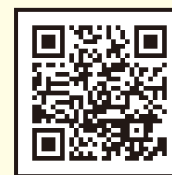
▲令和6年度当初予算

公明党議員団が昨年10月13日に大野知事に対し、春日部市の地域要望をはじめ、長引く物価高や激甚化・頻発化する防災・減災対策などの主張した項目が、新年度予算の様々な部分に取り入れられました。