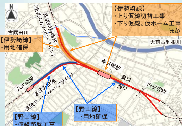
令和6年度 春日部連立の事業内容について

国の事業認可を取得した令和元年12月以降、県主体の高架化事業は多くの関係者のご理解とご協力に支えられ順調に進行しています。県は新年度予算として約30億3千万円を確保しました。予算執行による事業内容は下図をご参照ください。